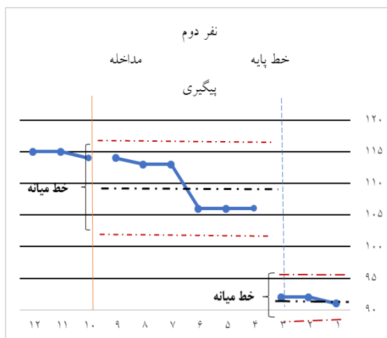
شکل 5. خط میانه و محفظه ثبات