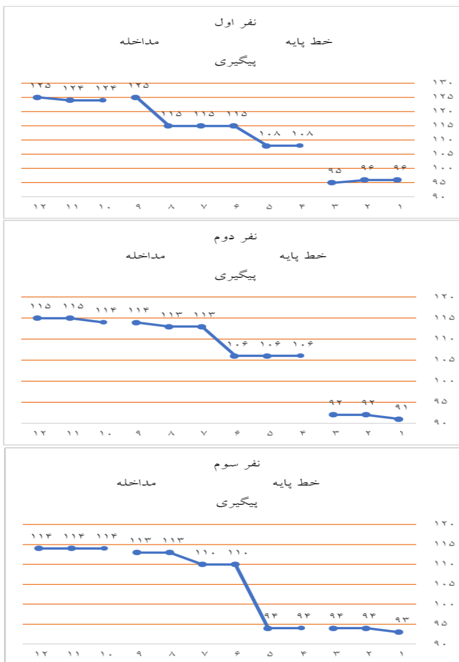
شکل 1. نمرات بهزیستی روانشناختی در موقعیت خط پایه، مداخله و پیگیری

جدول 4، تحلیل درون موقعیتی و بین موقعیتی تاثیر آموزش برنامه هوش موفق بر بهزیستی روانشناختی در دانش آموز تیزهوش کم پیشرفت اول مشاهده می‌شود.