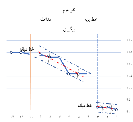
شکل 3. خط میانه و محفظه ثبات