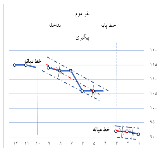
شکل 4. خط روند و محفظه ثبات