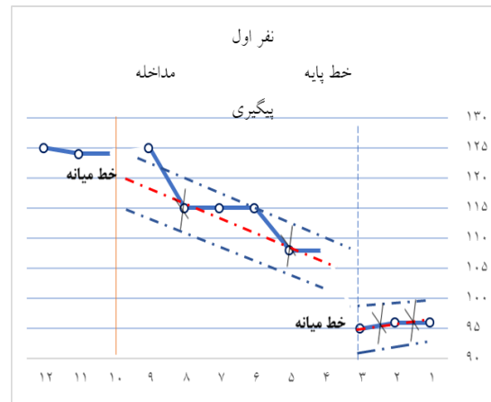
شکل 2. خط روند و محفظه ثبات