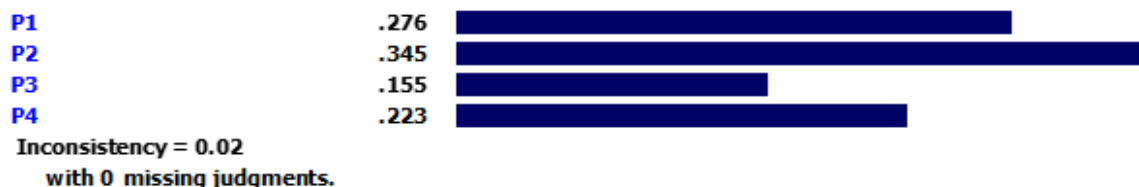
شکل ۷. اوزان شاخص‌های پیامدی

با توجه به شکل ۶، در بین شاخص‌های مداخله‌گر، حقوق و مزایا با وزن ۰/۴۴۹ رتبه اول، تمرکز زدایی با وزن ۰/۲۵۵ رتبه دوم و جذب و گزینش نیروی انسانی با وزن ۰/۲۹۷ رتبه سوم را کسب کرده‌اند. معیار پیامدی دارای ۴