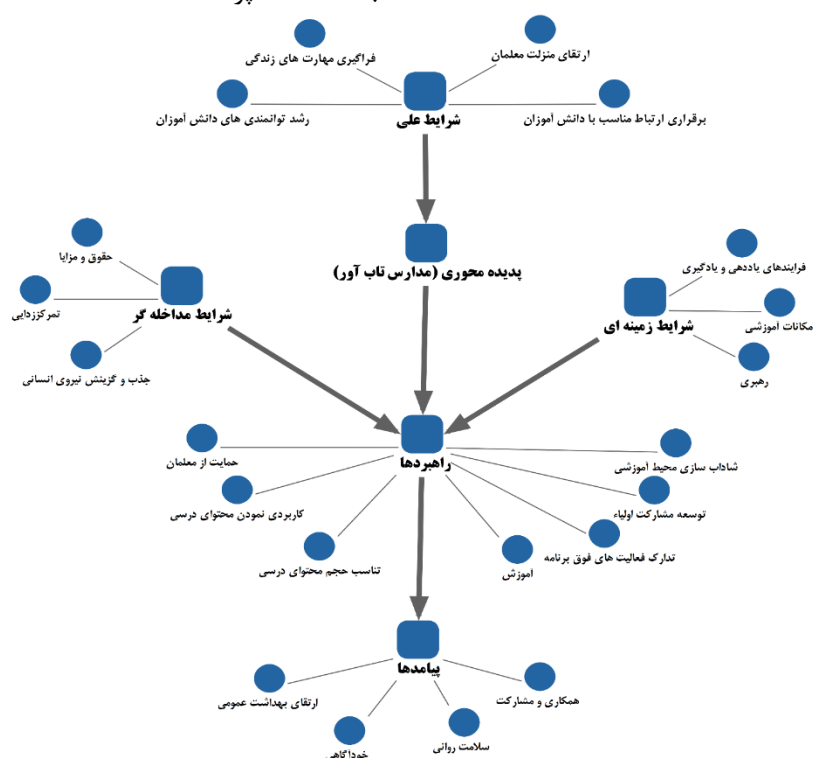
شکل ۱. الگوی برآمده از نظریه داده بنیاد به روش سیستماتیک