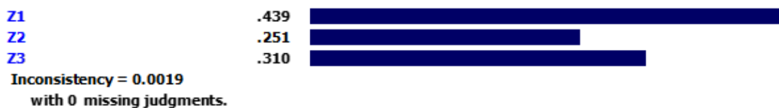
شکل ۵. اوزان شاخص‌های شرایط زمینه‌ای

با توجه به شکل ۴، در بین شاخص‌های راهبردی، تدارک فعالیت‌های فوق برنامه با وزن ۰/۲۰۶ رتبه اول و کاربردی نمودن محتوای درسی با وزن ۰/۱۰۱ رتبه هفتم را کسب کرده‌اند. سایر نتایج در جدول فوق آمده است. معیار