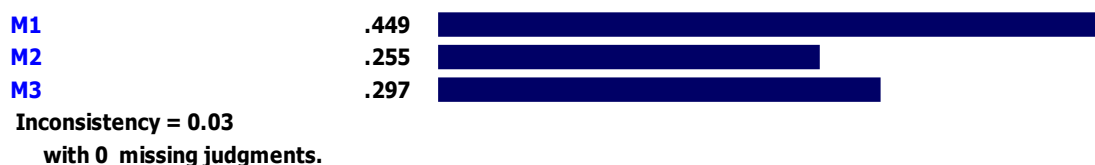
شکل ۶. اوزان شاخص‌های شرایط میانجی (مداخله‌گر)

با توجه به شکل ۵، در بین شاخص‌های زمینه‌ای، امکانات با وزن ۰/۴۳۹ رتبه اول، فرایندهای یاددهی و یادگیری با وزن ۰/۳۱۰ رتبه دوم و رهبری با وزن ۰/۲۵۱ رتبه سوم را کسب