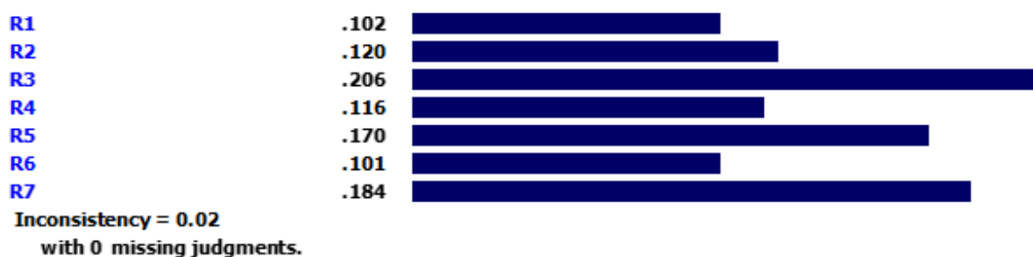
شکل ۴. اوزان شاخص‌های راهبردی

با توجه به شکل ۳، شاخص فراگیری مهارت‌های زندگی با وزن ۰/۳۸۱ رتبه اول را کسب کرده است. معیار برقراری ارتباط مناسب با دانش‌آموزان با وزن ۰/۲۵۳ رتبه دوم، معیار ارتقاء منزلت معلمان با وزن ۰.۲۲۱ رتبه سوم و